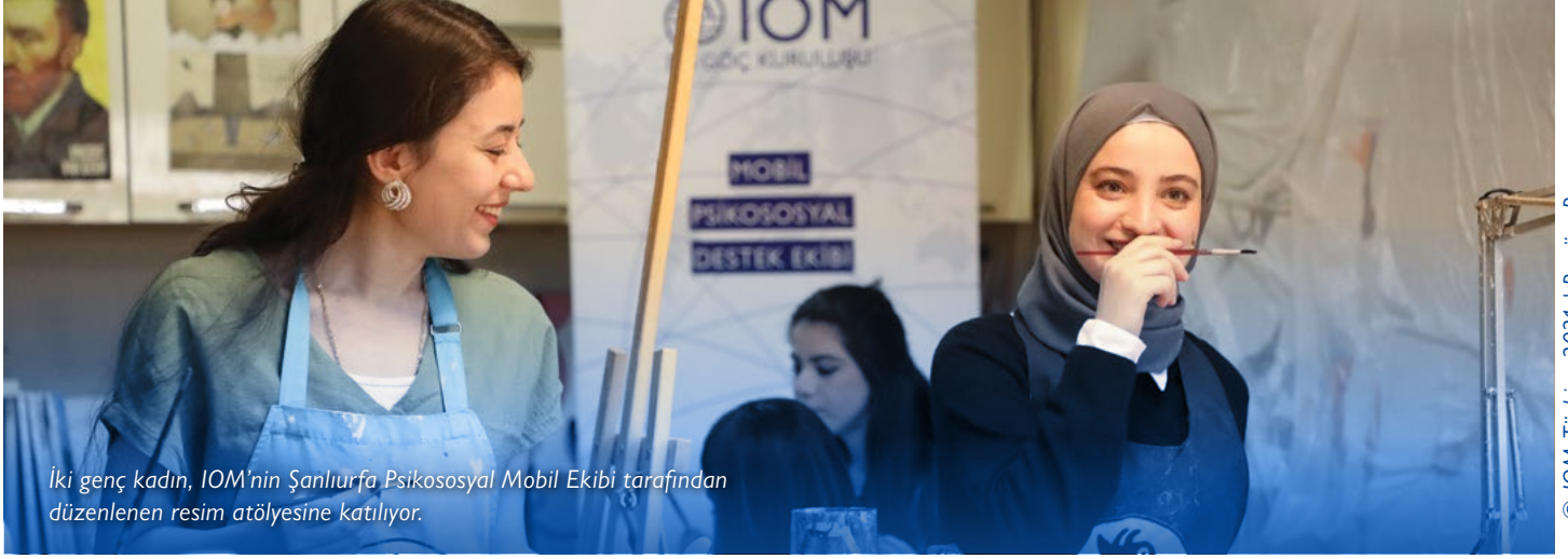
İki genç kadın, IOM'nin Şanlıurfa Psikososyal Mobil Ekibi tarafından düzenlenen resim atölyesine katılıyor.