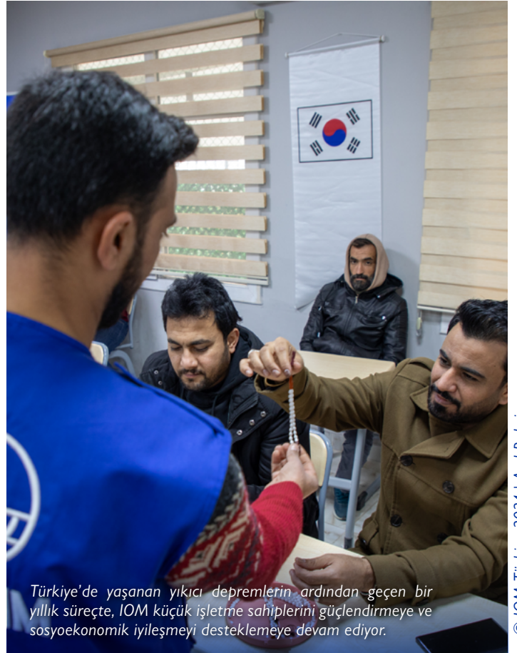
Trkiye'de yaŐanan yıkıcı depremlerin ardından geen bir yıllık srete, IOM kk iŐletme sahiplerini glendirmeye ve sosyoekonomik iyileŐmeyi desteklemeye dvam ediyor.

Ayrıca, İzmir'deki Tekerlekli Sandalye Bakım Onarım Atlyesi ve Engelli Hizmetleri Merkezi'ne saėlanan desteklerden 500 kiŐi faydalandı. Bu destek kapsamında gmen, mlteci ve ev sahibi toplulukların faydalandıėı ekipman ve mobilyalar temin edildi.