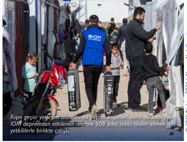
KıŐın geici yerleŐim alanlarında yaŐam koŐulları daha da zorlaŐıyor. IOM depremde etkilenen ailelere 508 adet ısıtıcı teslim etmek iin yetkililerle birlikte alıŐtı.

Temel ihtiyaların sürekli olarak karŐılanmasını saėlamak iin IOM, yerel yetkililerle yakın bir Őekilde alıŐtı. Bu alıŐma zellikle barınma ve gıda diŐi malzemelerin saėlanması konularına odaklandı. IOM, lke apında depremde etkilenen 264 haneye kira yardımı saėladı. Ayrıca Adıyaman, Hatay ve KahramanmaraŐ baŐta olmak zere depremde etkilenen illere 2.000 adet ısıtıcı daėıtıldı. Adıyaman, Gaziantep, Hatay, KahramanmaraŐ ve Malatya'daki geici barınma merkezlerine giyim malzemesi yardımı saėlandı.